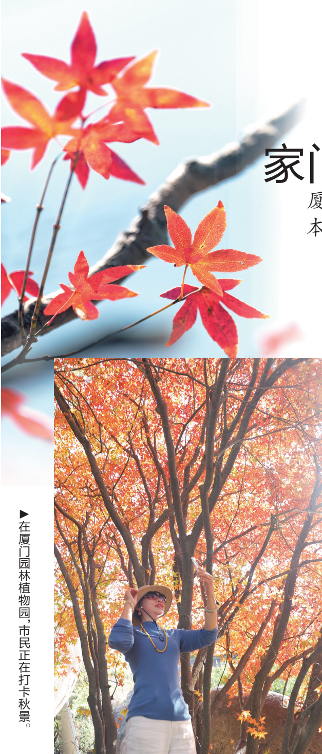
在厦门园林植物园,市民正在打卡秋景。

医护人员提醒,农药中毒救治需争分夺秒,急性中毒多表现为恶心、呕吐、出汗、肌肉颤动等,有机磷类常带刺鼻蒜臭味,口服或吸入后10分钟至2小时即可发病。误服后若患者意识清醒,可立即催吐并携带农药瓶就医;皮肤接触需脱污染衣物用肥皂水冲洗(敌百虫中毒禁用碱性液体),吸入者需转移至空气新鲜处。