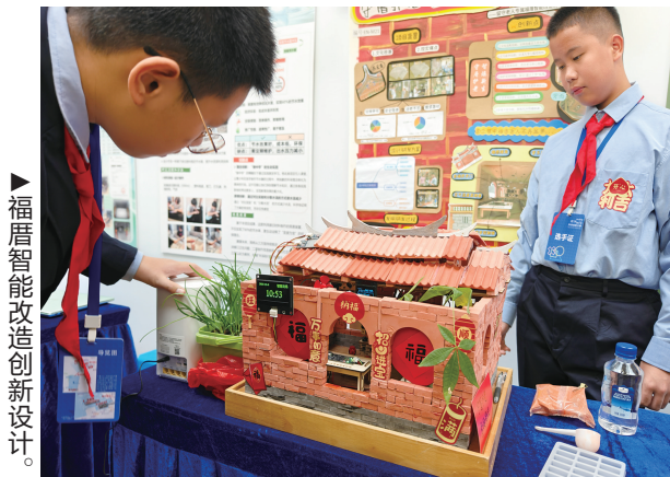
福厝智能改造创新设计。

大赛延续“竞赛+展示”双轨模式,设置五大核心赛项,覆盖不同年龄段青少年的科创能力展示需求。内容涵盖数学、物理与天文学、化学、生命科学等8个基础学科领域。