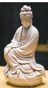
何朝宗款德化窑白釉观音坐像

此塑像是明代德化窑作品,自然灵动、惟妙惟肖,尤其在观音的眉眼、衣褶等细节之处,可见工匠雕工的精湛。