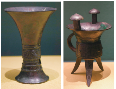
▲兽面纹觚(商代)。▲亚醜斝(商代)