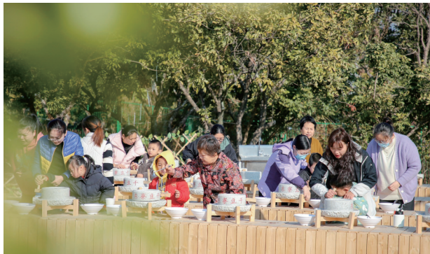
▲品牌赋能为乡村旅游提质增效,图为翔安东寮豆干制作体验。