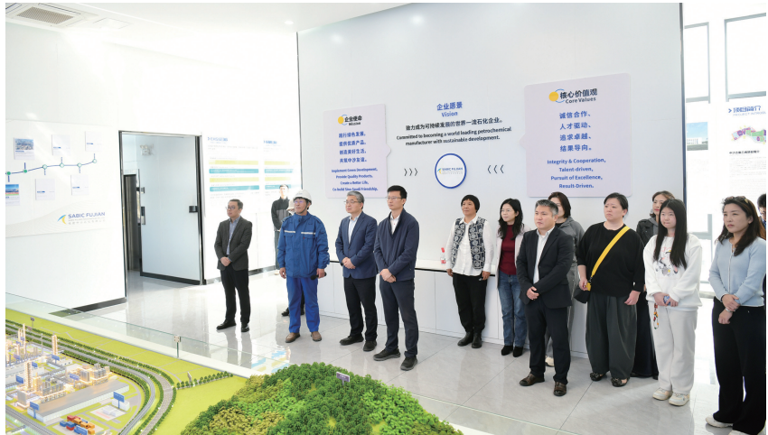
▲多名全球知名石油化工企业代表与中国石化联合会外资委员会一行走进古雷石化基地考察调研。

导报讯(通讯员 蔡彩霞 记者 洪婷婷)12月10日,来自沙特基础工业公司、陶氏化学等全球知名石油化工企业的多名代表与中国石化联合会外资委员会一行走进漳州古雷石化基地,现场见证古雷零碳园区建设奠基,并深入产业一线考察调研,探寻合作共赢新机遇,共创绿色零碳新未来。