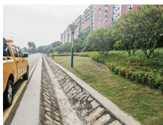
▲改造前的开放式公路边沟。

直属公路部门充分借鉴之前完善环岛路音乐广场段、溪头下、黄厝、山海苑路段等慢行系统的成功经验,组织实施了环岛路“一国两制 统