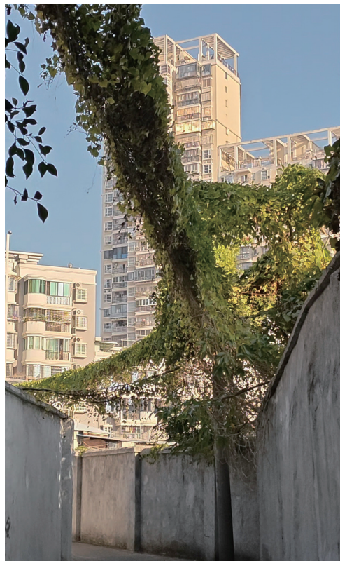
▲线缆被藤蔓缠绕,绵延数米。

穿行在小巷中,导报记者发现,这条巷道中的房子大多属于自建房,由于年代较为久远,电话线、网线等各种线缆杂乱地缠绕在一起,不少居民把数条交织而成的线缆当做“野生晾衣杆”,将衣物晾晒在上面。而当导报记者问起在线缆上晾晒衣物是否会感觉危险时,一居民回答:“应该不会吧,这个线缆应该没有电。”