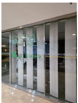
▲KK游泳健身馆翔鹭店大门紧闭。