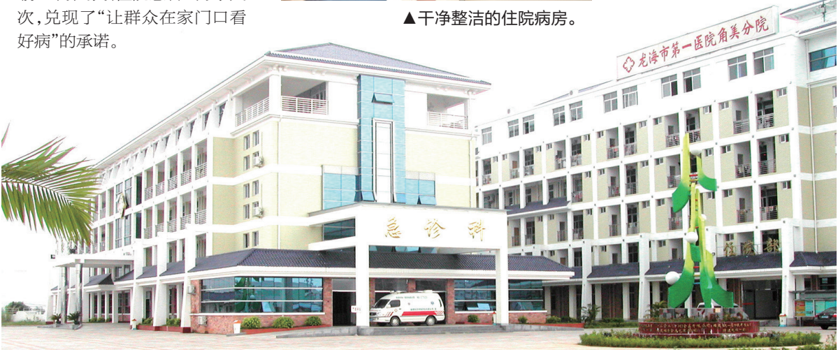
▲从龙海市第一医院角美分院开始起步。

廿载春秋铸辉煌，医心向党护健康。漳州市第五医院的20年，是与区域发展同频共振、与群众健康休戚与共的20年。未来，医院将以建院20周年为契机，坚持党建引领高质量发展，传承院训初心，深化医联成果，在守护人民健康的道路上续写新篇！