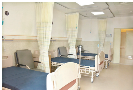
▲干净整洁的住院病房。