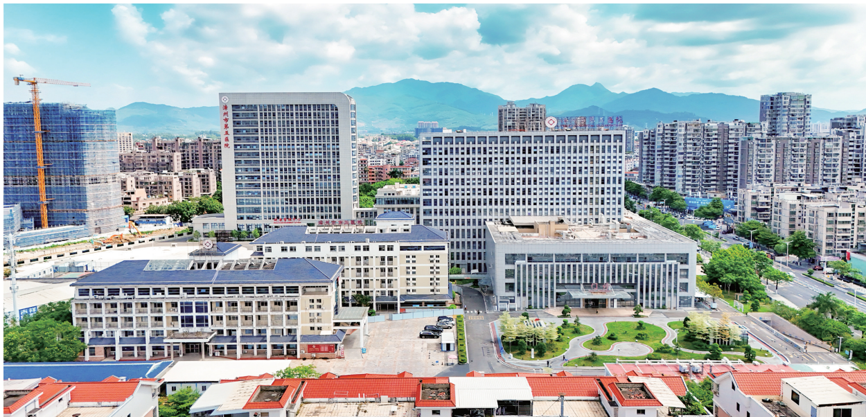
▲漳州市第五医院崭新的面貌。