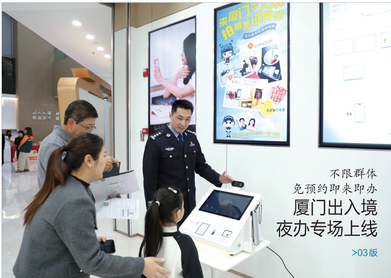
▶ 夜办专场还上线了最美证件照模块，图为市民在拍摄「最美证件照」。