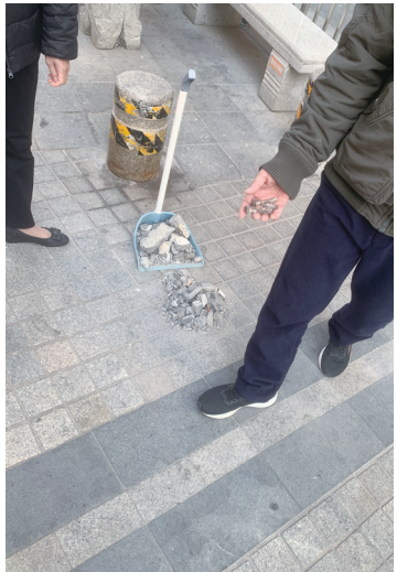
▲裂成数十块小石块,掉落在楼栋大门口。