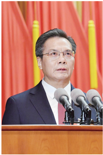
▲市长伍斌作政府工作报告。