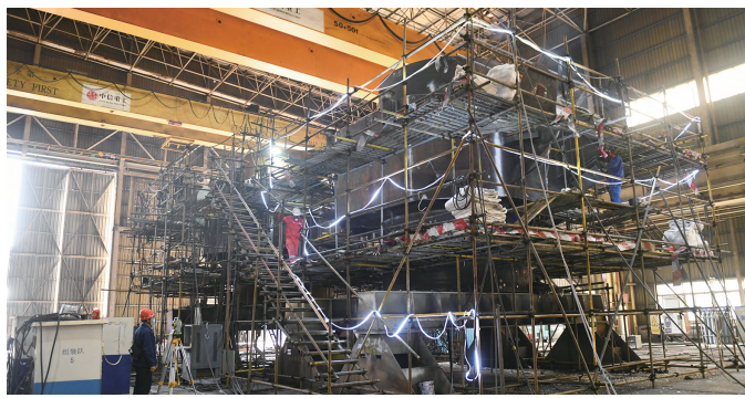
▲正在赶制中的全球最大漂浮式风机桩基。