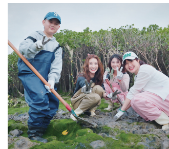
▲林夏薇(左二)前往下潭尾参与红树林种植。

值得一提的是,厦门市文旅局还在此次行程中为林夏薇颁发了“厦门2026年度美好生活推荐官”荣誉。作为土生土长的厦门姑娘,从中央戏剧学院科班出身到TVB视后,她始终心系故里,此次归乡的多重体验更让她深受触动。她表示,此次厦门行不仅让自己重新沉浸在闽南文化的底蕴之中,更亲眼见证了家乡在非遗活态传承、城市更新与生态建设上的亮眼成果。