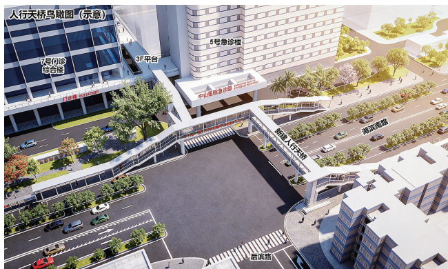
▲人行天桥建成后鸟瞰效果图。

目前,行人和非机动车由后滨路口斑马线过街。天桥建成投用后,将取消后滨路口东、西侧斑马线,行人可通过