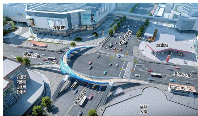
▲“C”型天桥效果图。

天桥主桥长90米,三条梯、坡道总长124米,跨湖滨南路和湖滨东路,旨在实现“缓解人车冲突”和“打造城市景观节点”的双重目标。天桥建成后,将实现三个