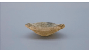
▲一期文化遗存:尖圆底陶片。