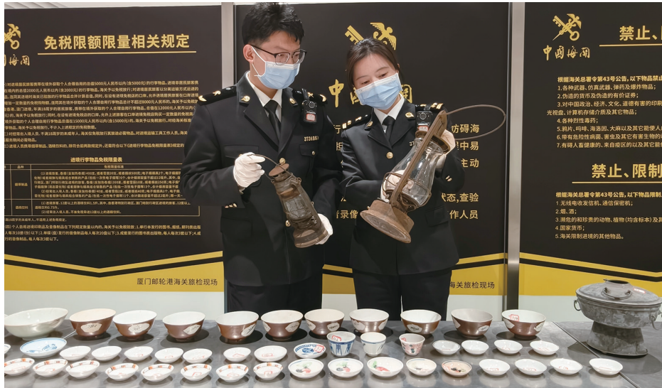
厦门邮轮港海关查获现场。图中展示了查获的76件文物，包括各式瓷器、马灯等。海关工作人员正在对这些物品进行登记和检查。