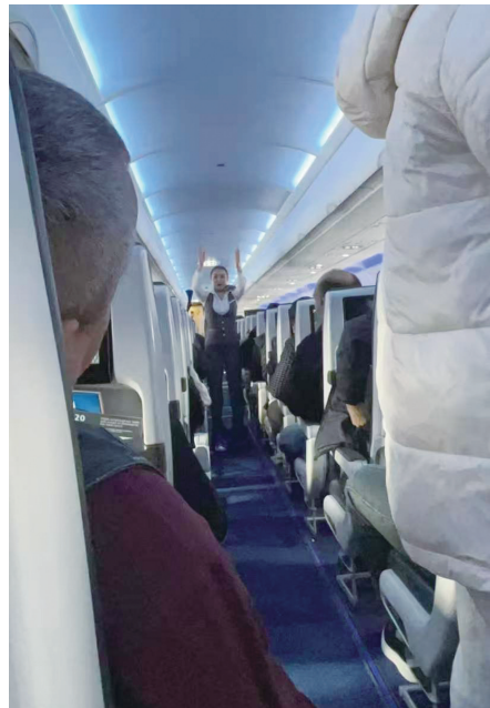
▲侨胞们登上回国的飞机。