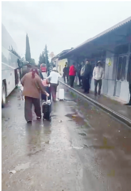
▲侨胞们登上前往阿塞拜疆的大巴。