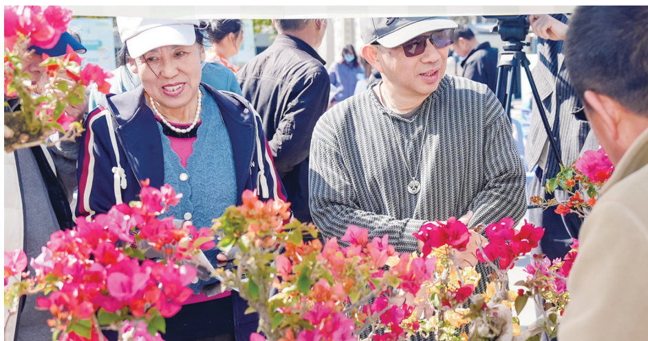
厦门市花卉协会现场展示众多品种三角梅。

2026年,厦门将继续实施植树造林、绿地更新、绿道建设等工程,不断提升城市绿色空间品质。计划完成植树造林1438亩、森林抚育9519亩;新建及改造城市园林绿地100公顷;建设口袋公园20个、立体绿化30处;打造为民办实事绿道13公里(含2个绿道精品工程),建设20亩省级“互联网+全民义务植树”实践区。