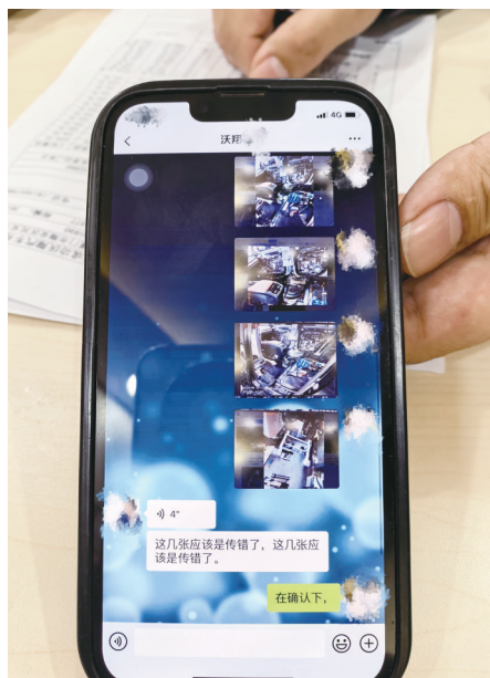
▲维修店工作人员称图片传错了。