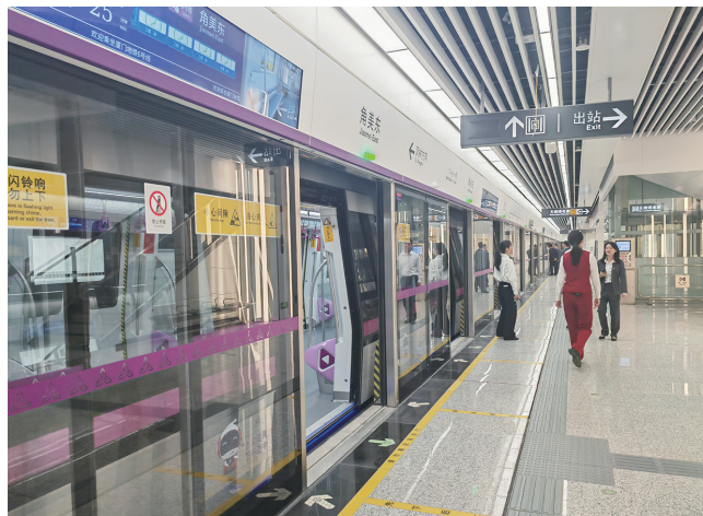
▲地铁到达角美东站。

目前,角美延伸段已完成主体工程、轨道铺设及冷热滑试车,24个出入口正加紧施工,社头车辆基地等配套同步推进。按照计划,试运行将分