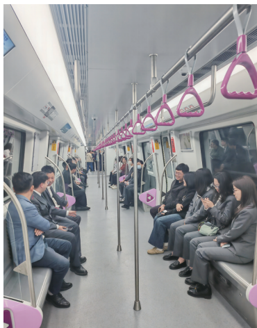
▲媒体记者和市民体验试运行。

通车后,角美居民坐地铁直达厦门集美、海沧将成为现实,厦漳两地通勤时间大幅缩短,真正实现“半小时生活圈”。这不仅完善厦门公共交通网络,更能为厦漳同城化注入新动能,加速两地人才、产业、资源要素流动,推动闽西南协同发展格局迈上新台阶。