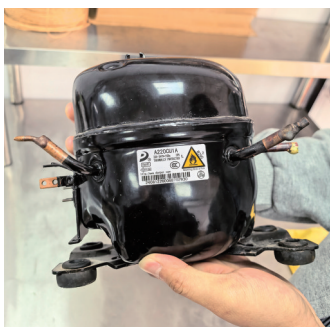
▲更换下来的压缩机。