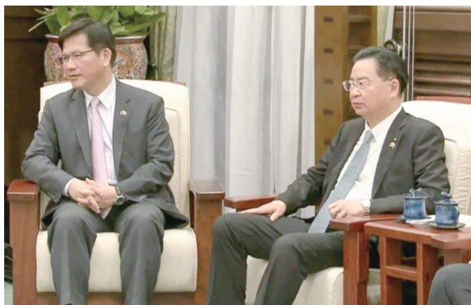
▲台“驻美代表”爆发丑闻牵扯出林佳龙(左)与吴钊燮内斗。

近日,民进党高层爆发新一轮权力斗争,台湾地区所谓“驻美代表”俞大濡再爆丑闻,包括职场霸凌、滥用公款等,这已经不是他第一次爆发丑闻,因此很快又成为岛内舆论焦点。不过,这场风波的背后,实质很可能是分别以台安全会议秘书长吴钊燮和台外事部门负责人林佳龙为首的两大派系之间的争斗。