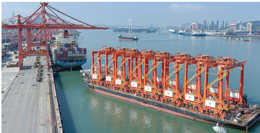
▲新一代RTG设备运抵厦门港。

导报记者在海天码头现场看到,此次新一代RTG设备采用标志性亮橙色涂装,8台“大块头”外观沉稳醒目,兼具力量感与科技感。相比传统设备,新一代RTG在性能方面表现突出,额定起重量达41吨,适配“6排集装箱+1条车道”主流布局,有效提升空间利用率与作业效率。此外,在节能减排、运行稳定性及维护成本控制等方面也具备显著优势,为港口绿色转型提供