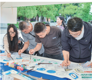
▲参与者在游戏区的职业健康主题涂鸦布上认真创作。

今年宣传周的主题为“守护职业健康,共建健康中国”,活动由省卫健委、省疾控局等单位联合主办,厦门市卫生健康委员会、福建省职业病与化学中毒预防控制中心、厦门工学院、厦门市疾病预防控制中心共同承办,集美区卫健局、集美区疾控中心等单位协办。活动现场,主协办各单位工作人员,省、市、区三级职业健康相关工作人员、厦门工学院师生、企业和劳动者代表近500人参与。