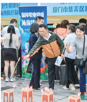
▲投壶游戏区,市民把箭矢投向标有职业危害因素的壶具。