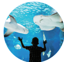
▲天柱山欢乐大世界

心乡谷自然生活节、安若小镇春日花花游园会……铜锣浴音声疗愈、中草药研学、草坪音乐会等活动轮番登场,五天连开不重样。无论你是想循着明星足迹打卡同款机位,还是只想在山野里泡汤听风、手作慢活,这里都能把假期妥帖地安放。