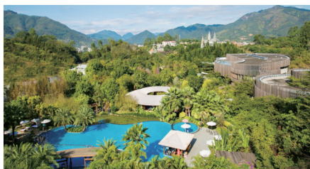
▲半月山乐动健康养生度假区

街头巷尾,则是另一种幸福。煎包皮薄底脆,咬一口汤汁四溢;四果汤是闽南人夏天的解暑神器;酸梅水果现切现拌,酸甜开胃。炸五香、干拌面、咸粿……这些地道的闽式风味,几块钱到十几块钱就能买到满满的幸福感。从早到晚,长泰的街头总有热气腾腾的小摊等着你。