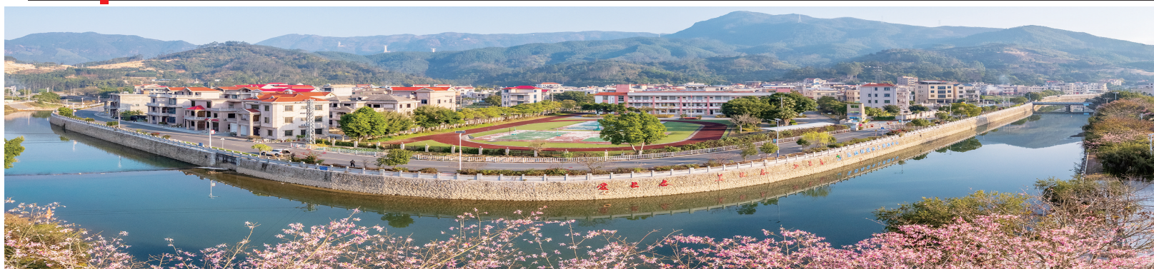
乐动林墩水上运动中心