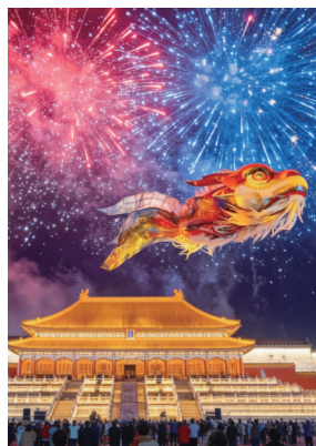
▲同安影视城“盛唐不夜天”。