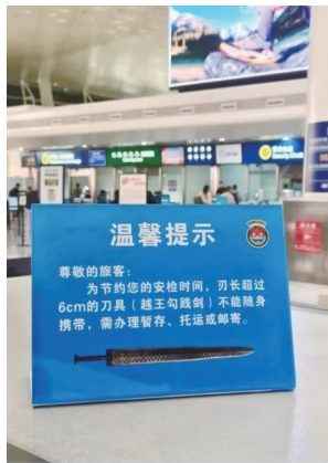
越王勾践本人来天河机场也得托运 天河机场T3安检...

说到底，规矩从来不是为了给人添麻烦。恰恰相反，正是每一条看似麻烦的规定，在保障着每一个普通人的安全。当我们笑着记住“勾践本