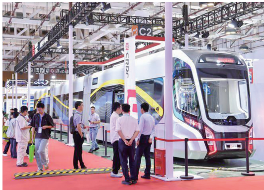
▲新一代“逸群”智慧快轨