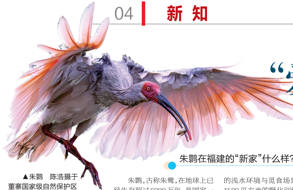
▲朱鹮于董寨国家级自然保护区