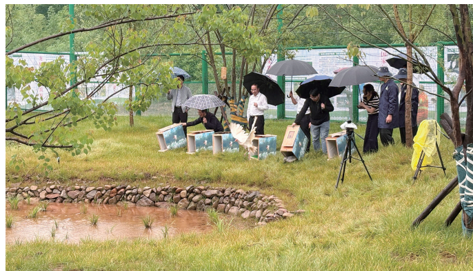
▲朱鹮重返福建安家。

这批朱鹮将在网笼里进行数月的适应性驯养，技术人员会逐步减少人工干预，模拟野外觅食环境，帮助它们练就一身“野外生存本领”。