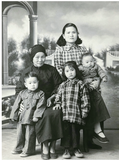
▲拍摄于1954年,我的阿嬷、母亲、大姐、大哥、二哥。