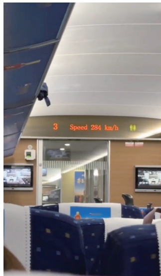
▲视频中高铁当时速度达到每小时284公里。