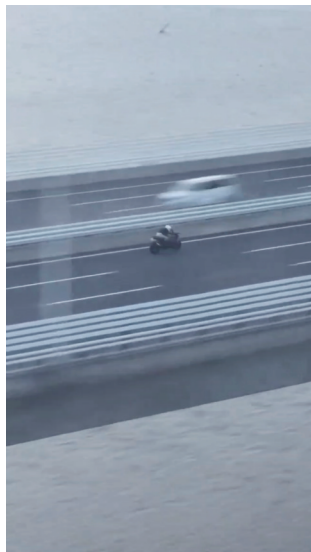
▲这辆摩托车与高铁几乎并肩飞驰。

通报称,公安机关始终坚持“零容忍”,严厉打击飙车等危害公共安全的违法行为,切实保护人民群众生命安全。