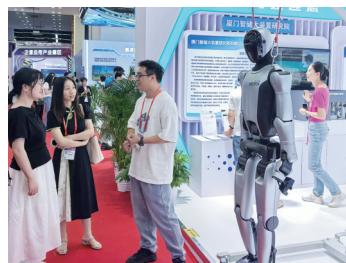
优必选人形机器人

研发的商用车智能座舱控制系统也让人眼前一亮。该系统搭载12.3寸全液晶仪表与智能中控屏,能够整合车速、路况、危险行为等,进行实时声光提醒,全覆盖保障车辆运营安全。目前,这一智慧交通产品已广泛应用于公交、旅游大巴、机场摆渡车等场景。