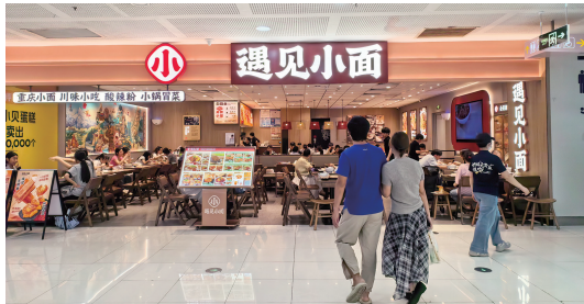
▲厦门一家遇见小面门店。