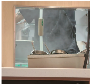
▲店员剪开一包料包,倒出一包粉末状的物体。